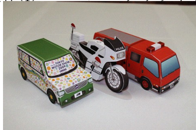
工作① ペーパークラフト3種